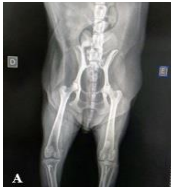
Figura 5. Radiografia de pós-operatório imediato em cão. A. Projeção Craniocaudal – Patela na posição proximal da tróclea no membro esquerdo e a presença do implante metálico na crista tibial.

Ao exame clínico feito 10 dias após a cirurgia, não houve reluxação patelar. Entretanto, 4 meses após a cirurgia, à radiografia, verificou-se a avulsão da crista tibial e a patela localizada cranialmente ao sulco troclear ( Figura 5 e 6 ).