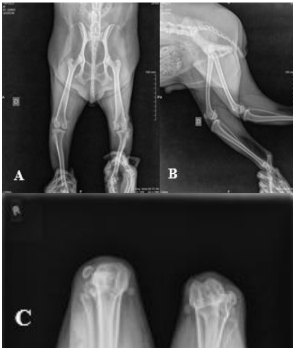
Figura 3. Radiografias de cão. A. Projeção craniocaudal – luxação patelar lateral bilateral. Não há alterações em articulação coxofemoral ou deformação femoral ou tibial. Patela esquerda luxada lateralmente com fio de cerclagem no côndilo lateral esquerdo. B. Projeção mediolateral – patela direita em posição anatômica normal. Não visibilização da patela em membro esquerdo. C. Projeção axial – luxação patelar lateral bilateral. Ausência de sulco troclear no membro direito. Sulco troclear aprofundado no membro esquerdo. Fio de cerclagem aderido ao côndilo lateral esquerdo.

Quatro meses após a segunda cirurgia, o animal sustentava menos peso no membro quando comparado anteriormente ao segundo acesso cirúrgico, chegando a mantê-lo na maior parte do tempo suspenso, além da evidente atrofia muscular pelo pouco uso. Demonstrava sensibilidade dolorosa ao exame físico de extensão e flexão nessa articulação. Foi submetido à terceira cirurgia, onde foi retirado o fio de