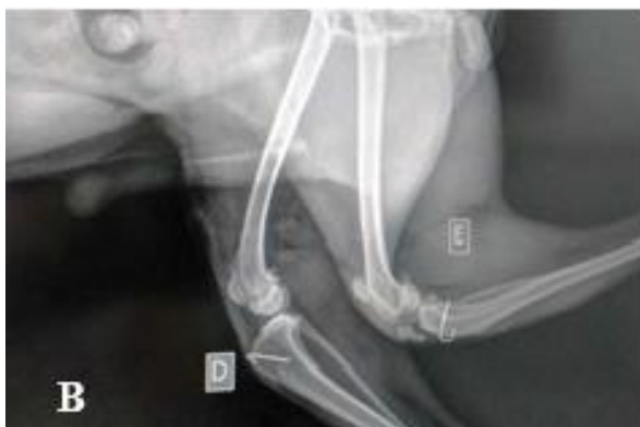
Figura 6. Radiografia de pós-operatório imediato em cão. Projeção Mediolateral – Patela esquerda cranialmente ao sulco troclear. Avulsão da crista tibial com deslocamento cranial.