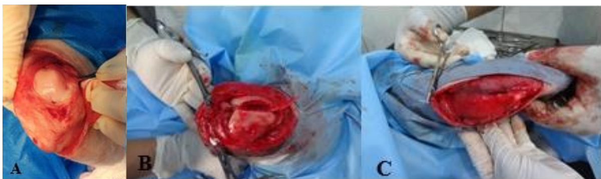
Figura 1. Transoperatório em cão. A. Tróclea rasa. B. Condroplastia troclear – elevação de retalho cartilaginoso. C. Pregueamento do retináculo medial.

Ao primeiro acesso cirúrgico, foi observada a tróclea rasa, feita a condroplastia e o pregueamento do retináculo medial ( Figura 1 ).