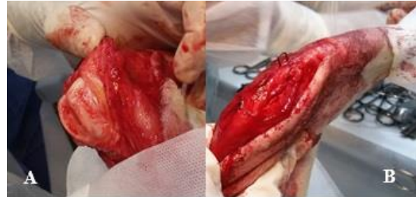
Figura 4. Transoperatório em joelho esquerdo de cão. A. Aspecto do sulco troclear após o aprofundamento da borda interna da crista tibial lateral. B. Utilização de um grampo de aço confeccionado com pino intramedular de steinmann para fixação da tuberosidade tibial.

cerclagem aderido ao côndilo lateral remanescente da cirurgia anterior e instituídos o aprofundamento do sulco troclear e a nova transposição da crista tibial com fixação, desta vez, por um pino de fixação, desta vez, por um pino de Steinmann modificado artesanalmente no formato de grampo ( Figura 4 ).