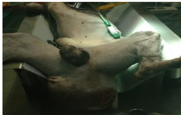
Figura 4. Pré-operatório do paciente em decúbito dorsal, onde pode ser notada diminuição no conteúdo herniado, após esvaziamento da ampola retal e punção da bexiga.

então feita punção da mesma no conteúdo herniado.