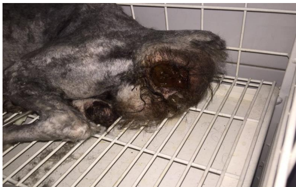
Figura 2. Imagem demonstrando a presença de uma massa na região perineal.

diagnosticado com hérnia perineal e encaminhado para os cuidados pré-operatórios ( Figura 4 ).