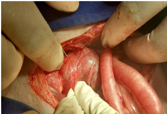
Figura 7. Incisão pré-retro-umbilical para realização de celiotomia exploratória.

No procedimento de cistopexia realizou-se também escarificação prévia, seguida de fixação com padrão de sutura simples contínuo com fio de poliglactina 910 (Figura 9). Ainda durante a celiotomia exploratória foi observado hiperplasia prostática (Figura 10).