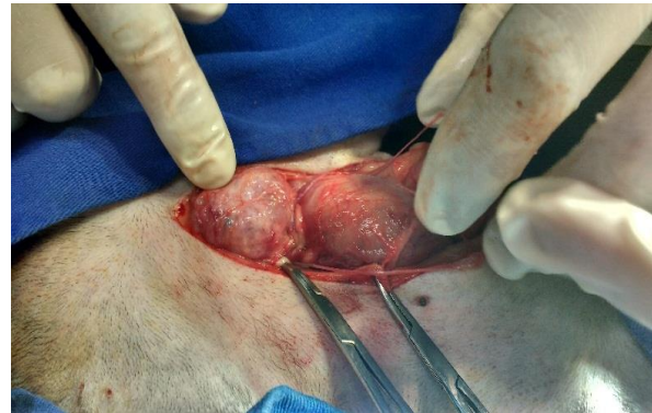
Figura 8. Imagem do acabamento final de colopexia em parede abdominal, com sutura simples contínua, transfixando a serosa com fio poliglactina 910 3-0

pontos, onde foi reavaliado. Suas funções de micção e defecação haviam retornado ao normal. O mesmo não apresentou quadro de recidivas nos seis primeiros meses após a cirurgia (Figura 11)