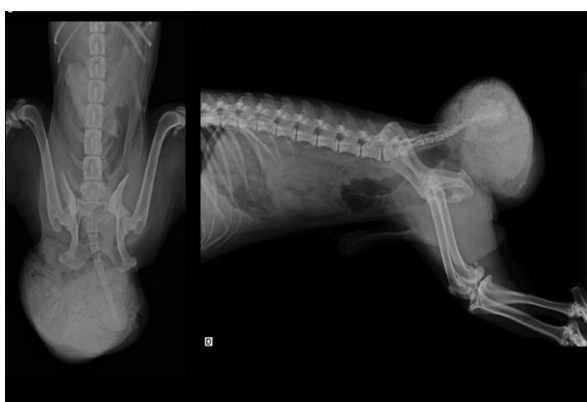
Figura 3. Imagem radiográfica em projeção ventri-dorsal e latero-lateral demonstrando um imagem radiopaca de contornos arredondados em região mais ventral (A) e outra com radiopacidade bastante aumentada em região mais dorsal (B).

Nos cuidados pré-operatórios, o paciente foi submetido à fluidoterapia a base de ringer com lactato por via intravenosa, além de iniciado um protocolo antimicrobiano a base de ceftriaxona 30mg/kg associado a metronidazol 15 mg/kg ambos a cada 12 horas. Diante do quadro de dor apresentado pelo paciente, este teve que ser submetido a anestesia epidural com lidocaína, para realização do exame de palpação digital do reto onde foi observado presença de fezes endurecidas e ressecadas na ampola retal e posteriormente realizado enema e remoção manual das fezes.