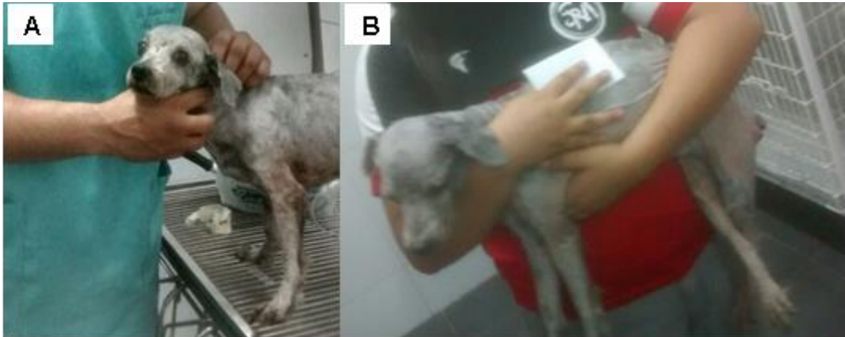
Figura 11. Animal no pós-operatório imediato (A), e seis meses após a cirurgia (B).

peridural com objetivo de diminuir a contaminação no transoperatório foi realizado enema e remoção manual das fezes no reto durante o pré-operatório imediato, conforme preconizado em literatura em que Costa Neto et al. (2006) realizaram enema num período de 60 minutos antes das cirurgias de herniorrafia.