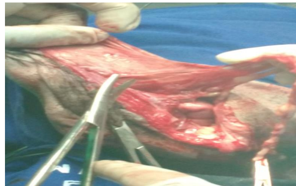
Figura 9. Imagem do acabamento final da cistopexia em parede abdominal, com padrão de sutura simples contínuo utilizando fio de poliglactina 910.