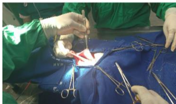
Figura 5. Aderência do omento em musculatura pélvica e alças intestinais compondo o conteúdo herniado

Foi realizado uma incisão semi circular na região da hérnia, sendo que a perineotomia revelou o anel herniário com aderência do omento à musculatura circunjacente e presença de alças jejunais ( Figura 5 ). A aderência do omento foi desfeita através de divisão romba, seguida do reposicionamento manual do omento e alças jejunais na cavidade abdominal.