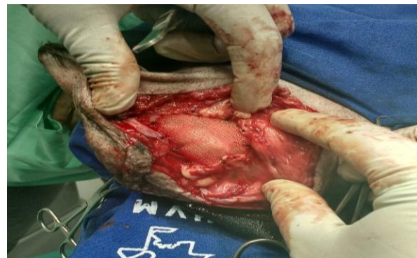
Figura 10. Próstata hiperplásica durante a inspeção da cavidade pélvica.