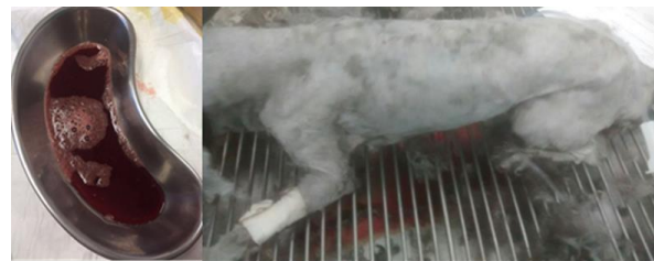
Figura 1. Hematúria observada no período pré-operatório.

Durante a consulta, foi relatada a queixa principal, sendo ela um aumento progressivo de volume na região perineal na última semana, sendo ainda relatado durante a anamnese anorexia e apatia que persistiam por uma semana, sendo que no dia anterior o paciente começou a apresentar disquesia, além de hematúria e êmese relatadas no mesmo dia do atendimento (Figura 1).