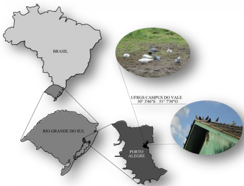
Figura 1 - Localização do Campus do Vale da UFRGS, Bairro Agronomia, Porto Alegre, Rio Grande do Sul, Brasil.

O campus do vale da Universidade Federal do Rio Grande do Sul está localizado no bairro Agronomia, município de Porto Alegre (Figura 1) e conta com 99 prédios. Foram vistoriados 85 prédios no ano de 2016 e a metodologia consistiu em recolher as fezes com o auxílio de uma espátula, depositá-las em sacos plásticos, com as análises executadas em até 24 horas no Laboratório de Helmintoses da Faculdade de Veterinária. Este projeto recebeu o número de protocolo de pesquisa do Comitê de Ética no Uso de Animais (CEUA) nº 20487/1.