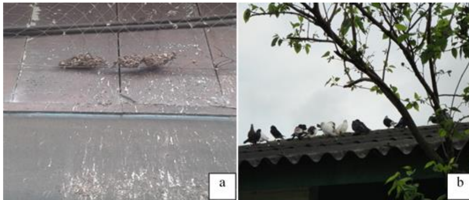
Figura 2 - a. Fezes em rede de proteção e parede suja; b. aves no telhado.

da Escola de Engenharia; Departamento de Ecologia; Departamento de Biofísica e Centro de Biotecnologia; Instituto de Física; Departamento Paleontologia e Museu Paleontológico do Instituto de Geociências; Laboratório de Pesquisa, salas de Físico-Química, do Departamento de Química Inorgânica e Biblioteca do Instituto de Química; Biblioteca do Instituto de Física; Administração, Secretaria e Depto. de Pós-Graduação de Instituto de Filosofia e Ciências Humanas; Centro de Estudos de Geologia Costeira e Oceânica do Instituto de Geociências; Departamento de Pós-Graduação do Instituto de Biociências; Salas de aula e Biblioteca do Instituto de Matemática e Física; e salas de aula do Laboratório de Informática.